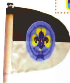
FIAMMA DI REPARTO