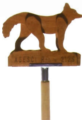
TOTEM DI BRANCO