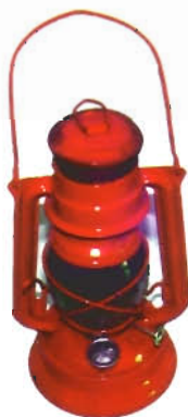
LANTERNA PER IL CERCHIO