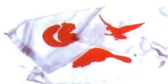
GUIDONE DI SQUADRIGLIA